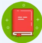
czytanie ze zrozumieniem